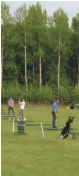
Ruda Golf cirka 8 km från Klockrike.