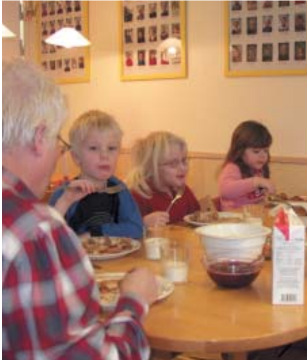
Klockrike förskola har egen kokerska som lagar all mat och bakar allt bröd.

Klockrike förskola bedriver en pedagogisk verksamhet som befrämjar lek, kreativitet och lustfyllt lärande. Vi arbetar med bl a Portfolio, språktimme och tema.