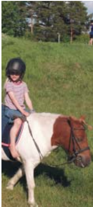
Hundpromenader och ridvägar finns alldeles inpå knuten.